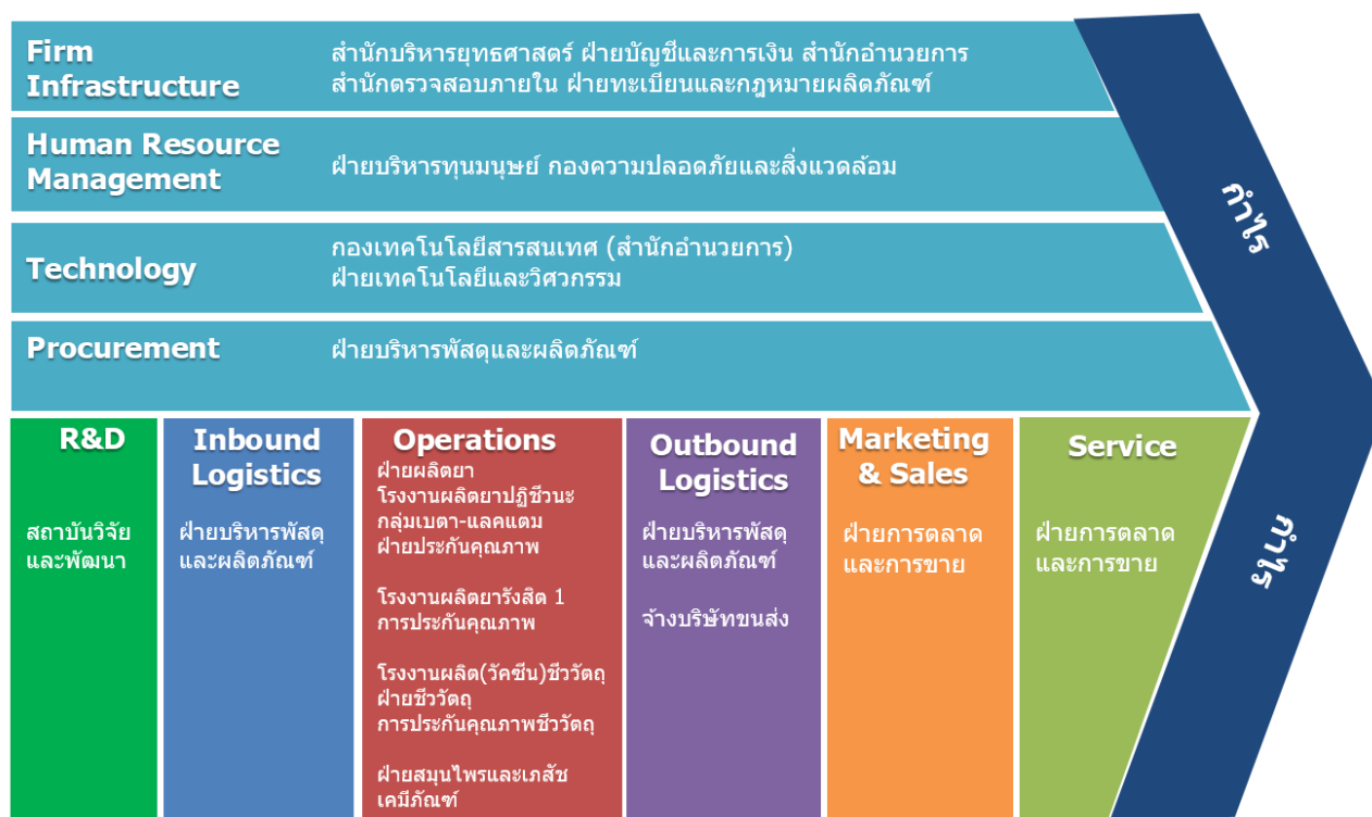
รูปที่ 1-1 : กระบวนการที่สำคัญตามห่วงโซ่คุณค่า (Value Chain)

ห่วงโซ่คุณค่า (Value Chain) ประกอบด้วย ระบบหลักเป็นระบบที่มีกระบวนการทำงานหลักที่ เกี่ยวข้องกับวิจัยและพัฒนา ผลิตยาและเวชภัณฑ์ เพื่อส่งมอบยาและเวชภัณฑ์ให้แก่ลูกค้า ซึ่งสอดคล้องกับ ความสามารถพิเศษขององค์กร มีกระบวนการที่สำคัญ ดังนี้